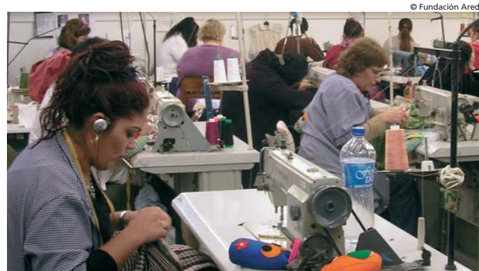
Taller de Confección Industrial de Ared

Día a día vemos reducir la vulnerabilidad social y seguimos avanzando con entusiasmo.